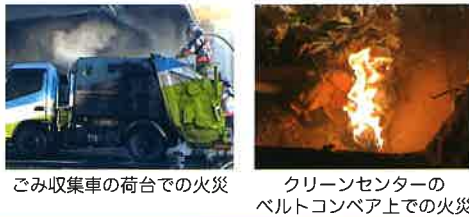
ごみ収集車の荷台での火災