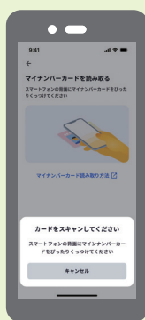
マイナンバーカードを端末の カード読み取り位置にかざすと 京都市民であることを認証