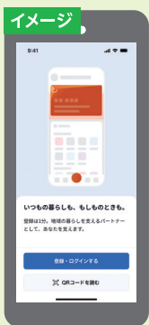
登録・ログインをはじめる