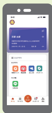
登録・ログインが完了